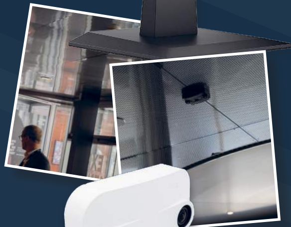
3D-kameraet fås også i en sort version.